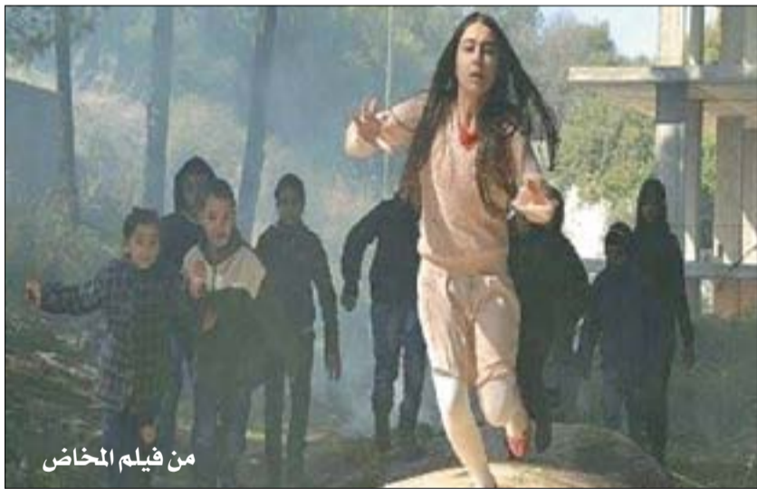
من فيلم المخاض

بمشاركة سورية بخمسة أفلام، ثلاثة طويلة وفيلمان قصيران، أفتتح أول أمس مهرجان الإسكندرية السينمائي الدولي في دورته الثالثة والثلاثون، التي تحمل شعار "السينما والهجرة غير الشرعية". ×ماورد " للمخرج أحمد إبراهيم أحمد- "الآب" للمخرج باسل الخطيب ضمن مسابقة "نور الشريف" للفيلم العربي الطويل لدول البحر المتوسط. "رجل وثلاثة أيام" للمخرج جود سعيد، في مسابقة الأفلام الطويلة لدول البحر المتوسط.