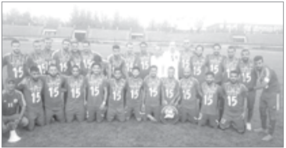
بعد الاحتفاظ بلقب بطولة دوري الرجال الموسم الحالي بكرة القدم، بدأت كرة نادي الجيش تعد العدة للموسم الجديد الذي ينتظر أن يكون أكثر قوة و منافسة. تحضيرات الفريق بدأت منذ فترة قريبة بقيادة كادر شباب طموح لديه من المؤهلات، ما يؤكد أن مسيرة الفريق ستبقى في قمته، ويأتي