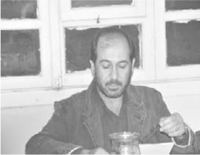
رقص الدمع مجموعة شعرية للشاعر نبيه عبد الحميد حسن

وهاهو يتابع تحليله لشخصيّة الدكتور "جوزيف" متقمّصاً دور المحلّل النفساني، الذي كان قد البسه إياه الدكتور دون أن يعي ذلك قائلاً: "هنا تقول إنك تعبر اهتماماً كبيراً لآراء زملانك (...)- لكن هذا ليس حلّاً صحيحاً،لأنّ ذلك يُعدّ استسلاماً لسلطة الآخرين. إنّ واجبك أن تقبل نفسك، لا أن تبحث عن سبيل لتكسب قبولي لك".لاحظ الدكتور "جوزيف" حججه العقلانية وأيقن أنّه يملك فكرة ثابتاً وأنّه لن يهزمه لذلك حاول اتخاذ منهج لعقلاني لعله يحرز نتيجة ما! ويسترسّل "نيتشه" بترتيب محاججاته مستشهدا بكتابه "العلم المرح" بأنّ العلاقات الجنسيّة لا تختلف عن العلاقات الأخرى في أنّها تنطوي هي أيضاً على صراع من أجل السلطة. وأنّه يكره الرجل الذي يستجدي الجنس فهو يتخلّى عن قوّة المرأة الماكرة التي تحوّل ضعفه وقوّته لصالح قوّتها، ومسؤوليتنا هي أن نفكر بإنشاء مخلوق أعلى، فروح الإنسان تكمن في اختياراته، وإذا قتلنا المقدّس، فعلينا مغادرة ملاذ العبد. وهنا يفكر الدكتور "جوزيف"