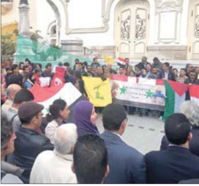
الآلاف يتظاهرون في تونس لتأييد بالعدوان الأمريكي على سورية

واصلت القوى الوطنية والعروبية، أمس، إدانة العدوان الأميركي على مطار الشعيرات، ورت أن العدوان جاء دفاعاً عن التنظيمات الإرهابية المنهارة، ومحاولة لبث الروح فيها بعد أن فشلت "إسرائيل" في القيام بهذه المهمة قبل ذلك، وأضاف: إن الولايات المتحدة الأميركية، راعية الإرهاب في العالم، سارعت لاستغلال جريمة استخدام المواب السامة في مدينة خان شيخون كذريعة لهذا العدوان، الذي يمثل انتهاكاً صارخاً لسيادة دولة مستقلة، وللقوانين والأعراف الدولية والأعراف الإنسانية جميعها، وشكلاً من أشكال إرهاب الدولة خدمة للمشروع الاستعماري الصهيوني، مشيرة إلى أن الذرائع الكاذبة التي تتسوّقها الولايات المتحدة الأميركية وحلفاؤها وعملاؤها للعدوان والحرب على سورية، سبق أن استخدمتها لتنفيذ العدوان على العراق، الذي انتهى باحتلاله عام ٢٠٠٣، وقد تكشّف بطلان تلك الذرائع جملة وتفصيلاً، ولم يعد منطقياً قبولها مرة أخرى.