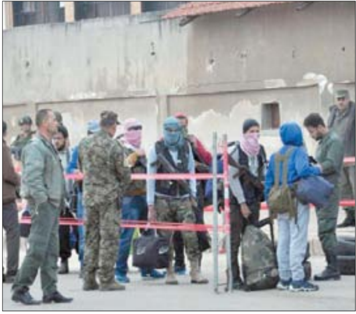
خروج الدفعة الرابعة من مسلحي حي الوعر

قبل أن تحف دماء شهداء مطار الشعيرات جراء استهدافه بصواريخ "توما هوك" الأمريكية المجنحة، أقدم طيران تحالف واشنطن المزعوم لمحاربة داعش مجزرة جديدة وهذه المرة بحق أهالي قرية هنيديا بريف الرقة الغربي راح ضحيتها ١٥ مدنياً على الأقل إضافة إلى إلحاق أضرار كبيرة بممتلكات المواطنين لضيف بذلك جريمة جديدة إلى سجله الدموي الأسود منذ تشكيله بشكل غير شرعي من خارج مجلس الأمن تضفاف إلى جرائمه في منبج والغندورة وطوخان الكبرى ودايق بريف حلب الشمالي والبوكمال بريف دير الزور الشرقي والهيشة والطبة والمشيورة بريف الرقة.