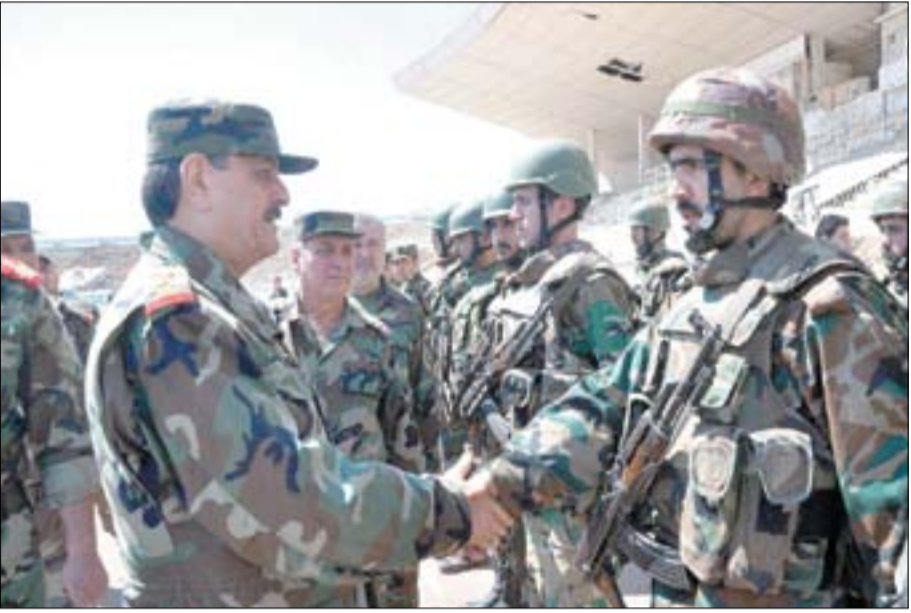
بتوجيه من السيد الرئيس الفريج بشار الأسد القائد العام للجيش والقوات المسلحة وبمناسبة الذكرى الـ ٧١ لعيد الجلاء قام المعاد فهد جاسم الفريج نائب القائد العام للجيش وزير الدفاع بزيارة ميدانية لعدد من الوحدات المقاتلة في درعا وريفها.

مجلس الشعب: نستلهم من نضالات أبطال الاستقلال قيم البطولة والفداء أهلنا في الجولان: نثق بسواعد جيشنا وحكمة قيادتنا لتحقيق النصر