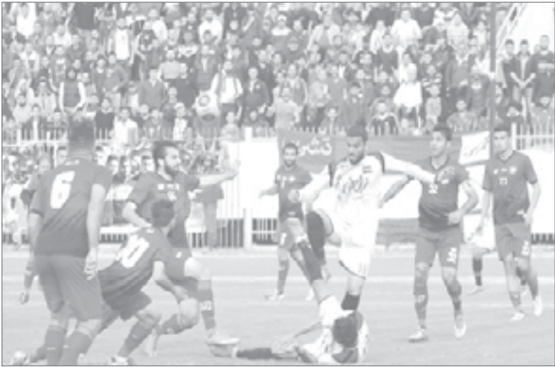
الأسوي، ويتصدر تششرين ترتيب الدوري، وله ٢٢ نقطة، يليه الشرطة ٢٧، ثم حطين ٢٤، فالاتحاد ٢٣، ثم الجيش ٢٠، والطليعة ١٩، فالوحدة ١٧، والمحافلة ١٢، الكرامة ١٤، والفئة ١٥، وجبلة والوثبة ١٥، والحرة ٨، وأخيراً الجزيرة ٤ نقاط.