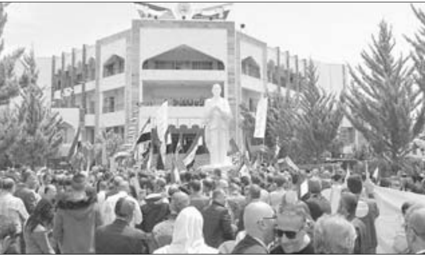
السويداء- رفعت الديك:

أكد أبناء السويداء المتمسكين بقيم والثواب الوطنية والمبادئ والأهداف التي أرساها حزب البعث والنهج الذي جسده القائد المؤسس حافظ الأسد والاستمرار بنهج المقاومة والتحرير خلف قيادة السيد الرئيس بشار الأسد والجيش العربي السوري الذي يسيطر أعظم ملاحم البطولة والتضحية دفاعا عن الوطن لتطهير أرضه من رجس الإرهاب وإعادة الأمن والاستقرار إلى ربوعه.