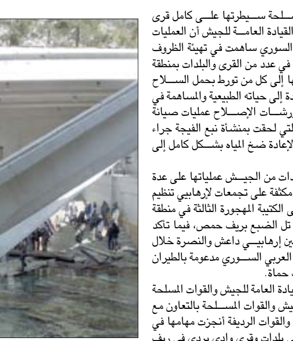
ورشات الإصلاح تدخل عين الفيحة