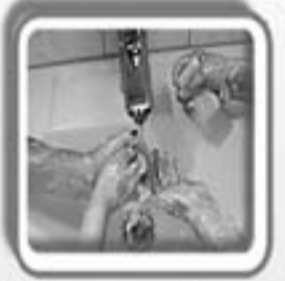
وزارة الصحة - مكتب الاعلام

غسل اليدين بالماء والصابون قبل تناول الطعام وبعد استعمال المراحيض هو أبسط قواعد النظافة التي تمنح الوقاية من المرض