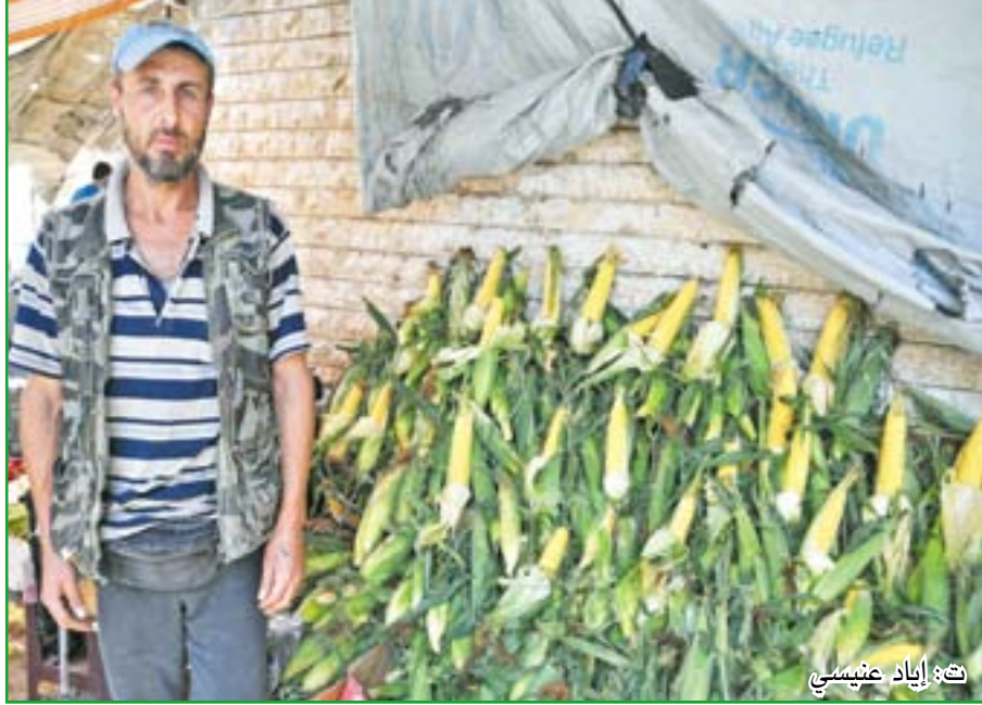
ت: إيراد عتيبيشي

في العالم"، قال أبو علي، وتابع: "لكنه يحتاج للماء وهو كما قلت غير متوفر".