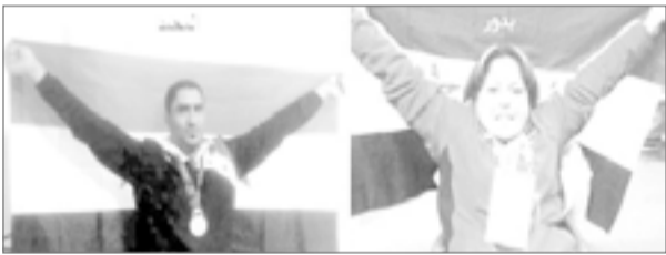
الفئالول لما حققتة بدور، وأثنوا على سير العملية التدريبية..