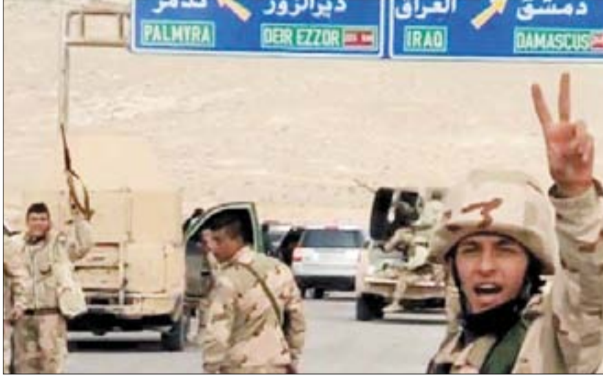
من عمليات الجيش في ريف حمص الشرقي