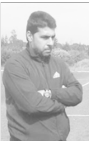
يذكر أن فريق الوحدة أحرز الموسم الماضي لقب مسابقة كأس الجمهورية بفوزه في المباراة النهائية على فريق الشرطة.

وسبق للكرامة أن تأهل إلى الدور نصف النهائي بفوزه على الحرية ٤-٢ بركلات الجزاء الترجيحية أيضاً، وسيلاقي في الدور نصف النهائي الفائز من لقاء مع الطليعة.