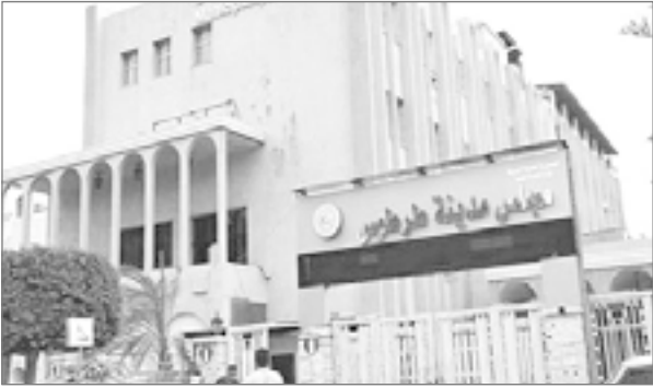
عرضة للسرقة والتلف.. فهل تصل صرخات المواطنين ومجلس المحافظة إلى الجهات العليا ويتخذ القرار رحمة بالعباد وبردًا لحاطر لا تُحمد عقباه!؟.