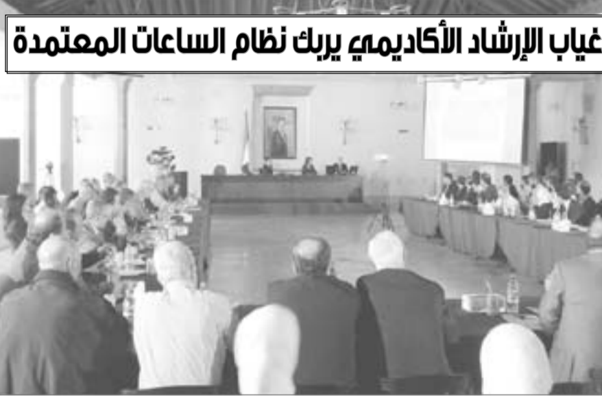
غياب الإرشاد الأكاديمي يربك نظام الساعات المعتمدة

مطالب عاجلة لوضع حد لتدخل المالكين بالعملية التدريسية وإعادة النظر ببعض القوانين الخاصة بالتعاقد!