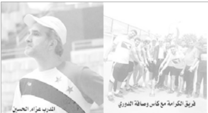
فريق الكرامة مع كأس وصافة الدوري

بعد الإنجاز اختصر الحسين كلامه برسالة قصيرة للسلة السورية واتحادها بالقول: للعبة تحتاج بالدرجة الأولى للمال حتى تستطيع الأندية المشاركة في الدوري بقوة وليس تادية واجب، لذا يجب على اتحاد اللعبة تأمين مستلزمات المالية وغيرها من أجل إقامة الدوري بنظامه المعروف (ذهاب وإياب)، والعمل على إصدار قانون يقضي بأنه لا يحق لأي نادي ضم أكثر من لاعبين منتخب وطني حتى يتحقق التكافؤ بين كل الفرق، ولا بد لي من أن أؤكد لاتحاد اللعبة أن سلة حطين حاضرة بقوة، والدليل دعوة ثلاثة لاعبين من الكرامة للمنتخب الوطني، لذا أرجو إصدار قوانين للحفاظ على التوازن بين الأندية لتبقى الندية والاثارة عنوان كل المباريات.