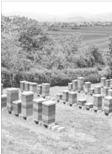
مخازن الإسمنت في درعا

يعاني مرضى السرطان في محافظة الحسكة، والوافدون إليها صعوبة انقطاع الطرق البرية إلى دمشق لتلقي الجرعات اللازمة في ظل استحالة تأمين حجز في السورية للطيران، وغلاء أسعار التكررة في الشركات الخاصة الأخرى، ناهيك عن المصاريف الإضافية في حال عدم توفر القطع بشكل مباشرة بعد انتهاء الجرعة، وهذا طبعاً مكلف جداً للمواطن، خاصة من لديه أكثر من جرعة في الشهر الواحد، مع العلم أن عدد المرضى في المحافظة