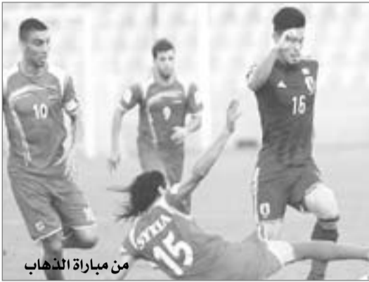
من مباراة الذهاب هدف، وخسارة كوريا الديمقراطية أمام الفلبين ٣-٢ وتعادل لبنان مع مينامار ١-١ .