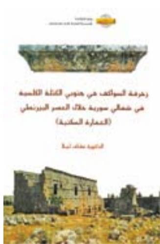
زخرفة السواكف في حوضي قلعة القنصية في شمالي سورية خلال العصر البيزنطي (العمارة السكنية)