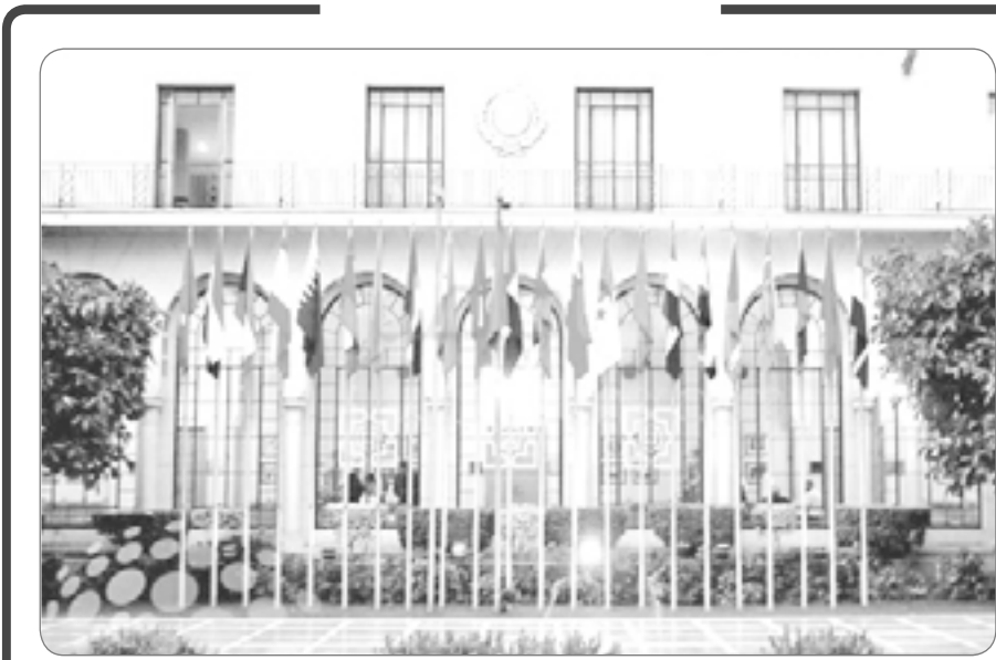
جامعة الدول العربية .. ماذا بقي منها ؟.

احتظلي يا جامعة العرب بميلادك الواحد والسبعين، ولن يبارك احتفالك من العرب إلا من كان على شاكلتك، احتظلي كما يحلو لعشاقك أن يكون الاحتفال، وأما نحن فاحتفالنا يوم تشهد الجامعة العربية وقد برأت من عجزها وكساحها، وتحتررت من ولاتها للاجنبي، وصلح شأنها، واستقام عودها، واستقل قرارها، وغدت الصلحة العربية عندها فوق كل المصالح، وتقدّر سنقول للجامعة العربية: 'عيد ميلاد سعيد يا جامعة العرب'.