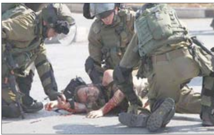
المجرمون الصهاينة يقتلون فلسطينياً قرب نابلس