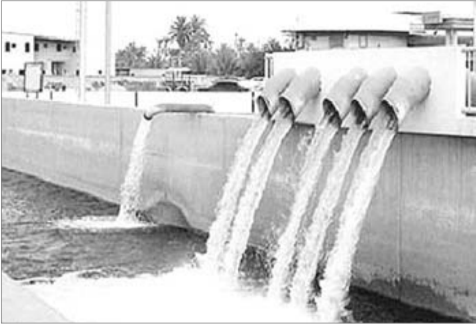
دمشق- نجوى عييدة