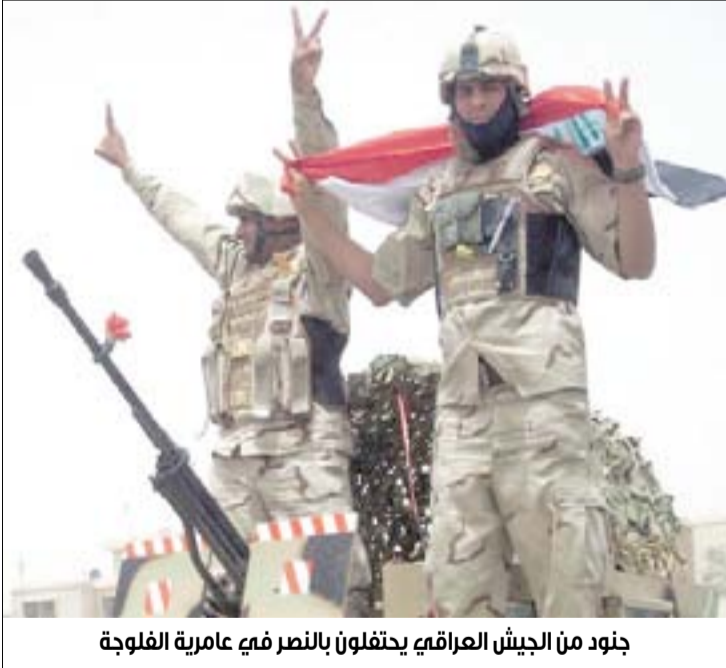
جنود من الجيش العراقي يحتفلون بالنصر في عامرية الفلوجة

ويظهر الفيديو، الذي عثر عليه مقاتلو الفوج الخامس التابع لحشد الأنبار العشائري داخل أحد المخزنين في الثامن عشر من شباط الجاري، استخدام التنظيم الإرهابي صفائح تحتوي على مادة كروسييف يو ان ١٢٠٥ تؤدي إلى حرق كل من يتعرض لها، كما كشفت الفيديو عدداً من التتمة ... 10ص