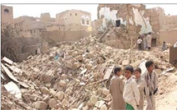
من آثار القصف السعودي الهجومي علىصعدة