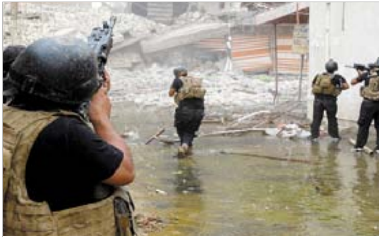
من عمليات الجيش العراقي فيه القائم

السلطان الحائر بين العلاقة الحميمة مع "داعش" والضغط الغربي، عقب وصول نار الإرهاب إلى أراضيهم، لقطع هذه العلاقة، ردّ عليه التنظيم الإرهابي برسالة تحذيرية ثانية خلال أشهر قليلة، وإلا فإن خلائاه